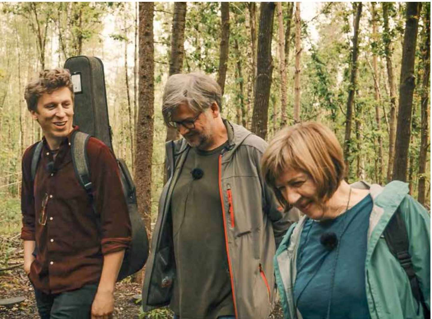
© Bert Huysentruyt (stilt uit de filmopname)